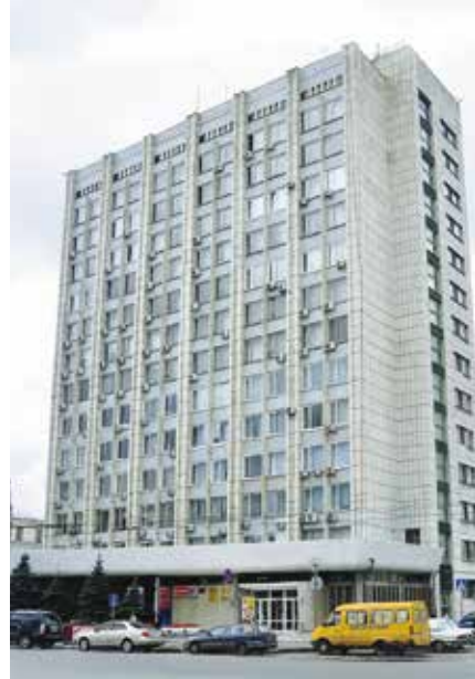
Административное здание Омского облисполкома

создана мощная производственная база с цехами, оснащенными оборудованием, складскими помещениями, подъездными путями. Ежегодно для рабочих сдавали два-три жилых дома, детские сады. Культурный досуг молодые рабочие проводили в ДК «Строитель».