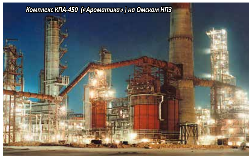
Комплекс КПА-450 («Ароматика») на Омском НПЗ