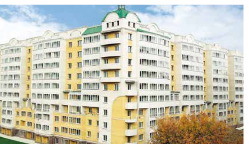
Жилой комплекс «Иртышские зори»