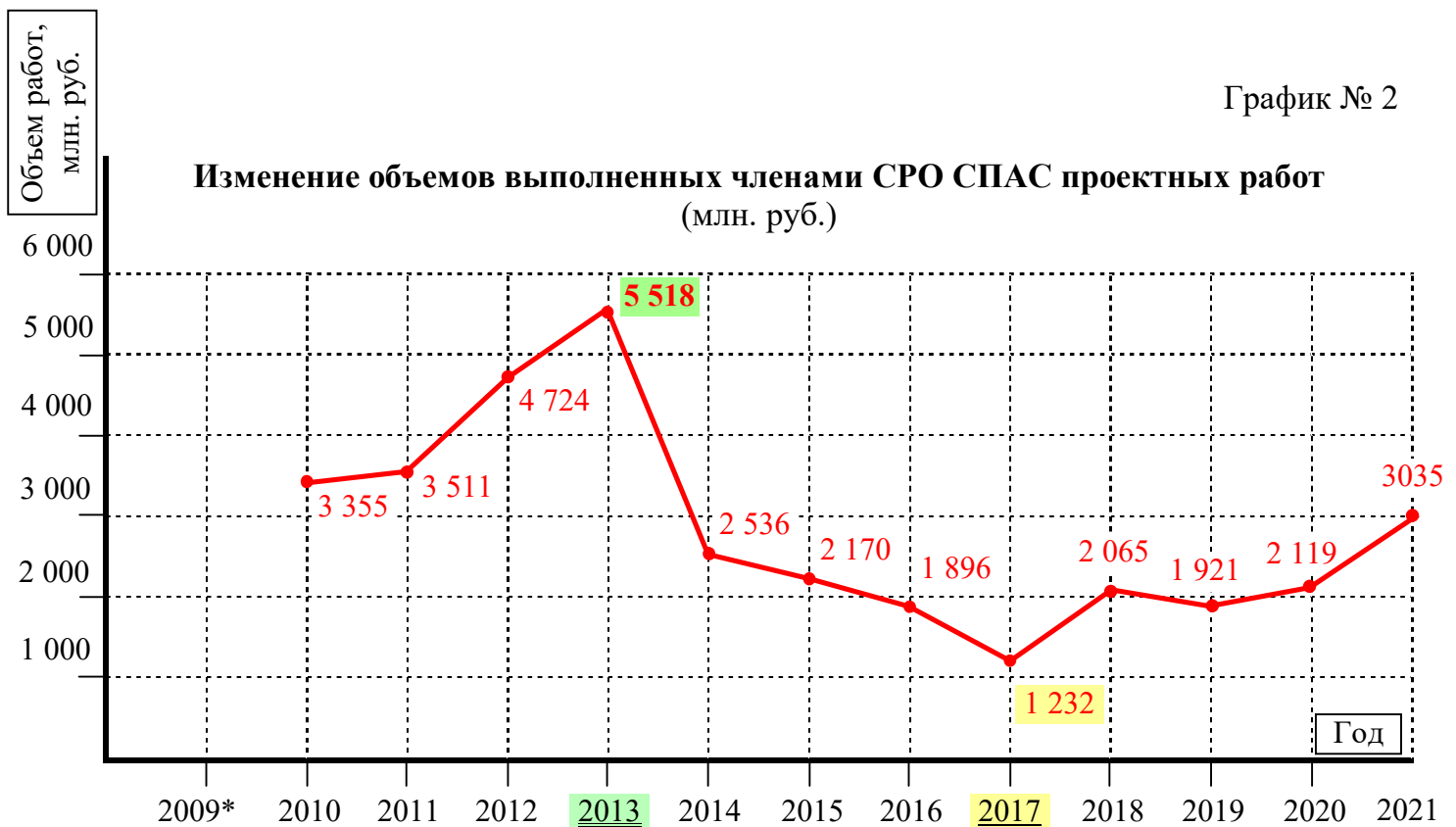
График № 2